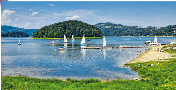
Jeziro Rożnowskie, widok na Małpią Wyspę

mirowicach znajduje się przystań jachtowa, a w Gródku nad Dunajcem plaża.