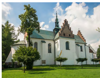
Klasztor w Szczyrzycy