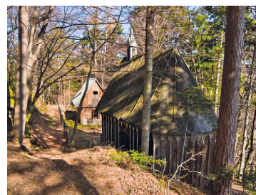
Krzestawice Podkamień - Pustelnia św. Benedykta

32.2 G Opactwo Cystersów w Szczyrzycy – założone w pierwszej połowie XIII w. Jest to jedyny w Polsce klasztor cystersów, który działa nieprzerwanie od swego założenia. Najcenniejszym obiektem zespołu jest kościół NMP Wniebowziętej z 1620 r., w którego głównym ołtarzu znajduje się obraz Matki Bożej Szczyrzyckiej. W domu Opata z XVI w. mieści się obecnie Muzeum Klasztorne. Przy opactwie działa również od XVII w. browar. W 2015 r. po wielu próbach udało się w Szczyrzycy wznowić warzenie piwa.