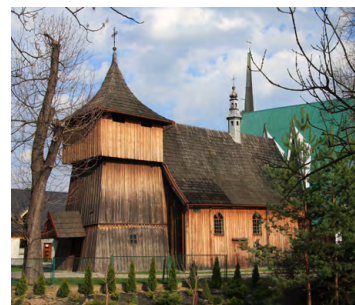
Kościół w Jodłowniku