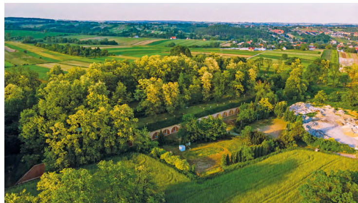
Fort 45 Marszowiec

Kontakt: Winnica Garlicki Lamus, Uniwersytet Rolniczy im. Hugona Kołłątaja w Krakowie Garlica Murowana 1, 32-087 Zielonki tel. 509 920 987 www.winnica.urk.edu.pl przemyslaw.banach@urk.edu.pl