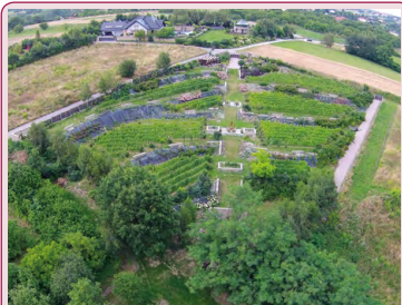
Winnica Święty Spokój

17,8 G Winnica Święty Spokój Niewielka rodzinna winnica znajduje się w miejscowości Zelków, na południowej krawędzi Wyżyny Jury Krakowsko-Częstochowskiej. Jej początki sięgają 2010 r. Plantację ulokowano na wysokości prawie 400 m n.p.m. Nawiązuje ona do tradycji „winnych ogrodów”, jakie w XVI i XVII wieku zakładano przy pańskich dworach i podmiejskich willach, zarówno we Włoszech, jak i nad Wisłą. Jest to uprawa tylnych użytkowa, co dekoracyjna, w której krzewy winorośli sąsiadują z zagonami wonnych ziół, kwiatów oraz innych roślin ozdobnych. Na terenie o powierzchni 70 arów, który częściowo otoczono kamiennym murem, zasadzono takie odmiany, jak: hibernal , seval blanc i solaris na wina białe oraz cabernet cortis , regent i rondo na wina czerwone.