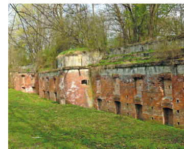
Fort 45a Bibice

24.7 H Fort 45a Bibice – mały, dwukondygnacyjny fort pomocniczy z lat