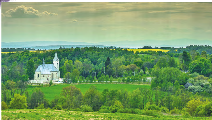
Kościół św. Jana Chrzciciela w Korzkwi

waną świątynię o funkcjach obronnych wzniesiono w 1623 r. na wzgórzu, ponad Doliną Korzkiewki. Obok znajdują się XIX-wieczna plebania i organistówka.