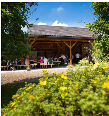
Winnica Krokoszówka Górská