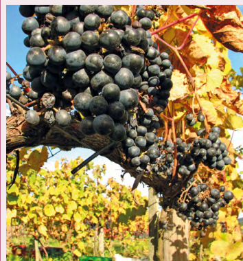
Winnica nad Dobrą Wodą

Kontakt: Winnica Nad Dobrą Wodą Garlica Duchowna 56, 32-087 Zielonki tel. 609 646 122 khamela@inetia.pl