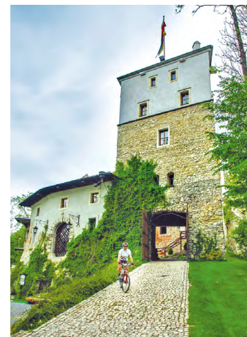
Zamek w Korzkwi

8,7 B Korzkiew, zamek – XIV-wieczna warownia rycerska pamiętająca czasy Kazimierza Wielkiego. Podupadającą od XVIII w. budowlę uratował potomek dawnych właścicieli, który