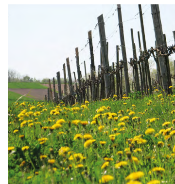
Winnica nad Dobrą Wodą