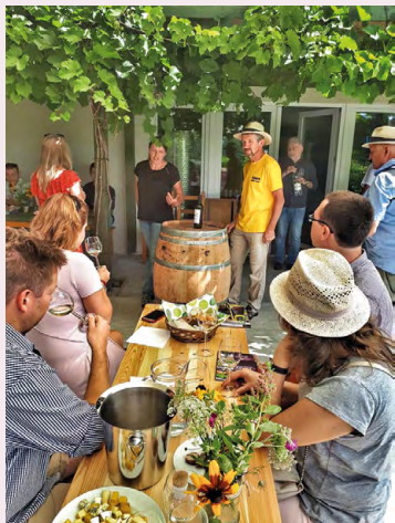
Winnica Słońce i Wiatr

To rodzinne przedsięwzięcie obejmujące prawie 2 ha upraw, rozrzuconych w trzech miejscach na terenie Jury Krakowsko-Częstochowskiej – od skrajnego Doliny Prądnika po Dolinę Dłubni. Są one usytuowane na zboczach o różnym nachyleniu i orientacji, w większości południowych, z dominującymi dość ciężkimi glebami gliniastymi na podłożu wapieni, na wysokości od około 300 m n.p.m. w Iwanowicach do prawie 400 m n.p.m. w Smardzowicach. Początki winnicy datowane są na 2011 r. W uprawie znalazły się wy-